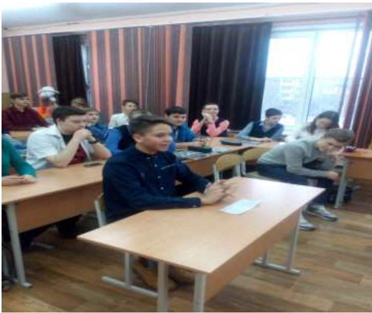
В.Г. Белинский – Румянцев Иван